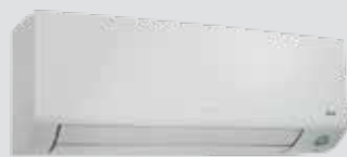
[ ATXM25-35A ]