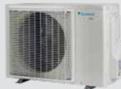
[ ARXM-A ]