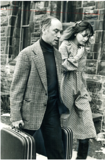
Mi madre junto al primer ministro de Canadá, Pierre Trudeau

(Abajo) Cuando cumplí catorce años, mi padre contrató a una bailarina que se hacía llamar «Polly Darton». No se recupera uno fácilmente de algo así