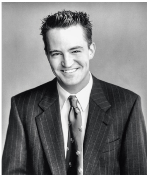
Mi primer y último retrato de estudio