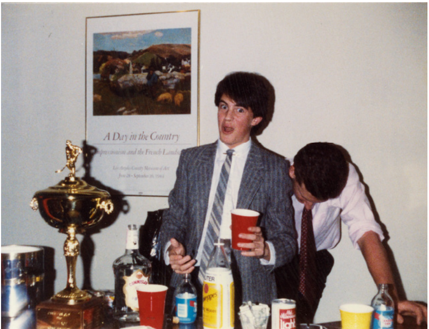
Y allá vamos