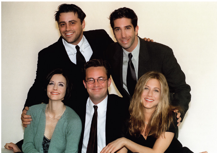
El mejor trabajo del mundo