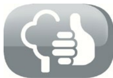
Respetuoso del medio ambiente